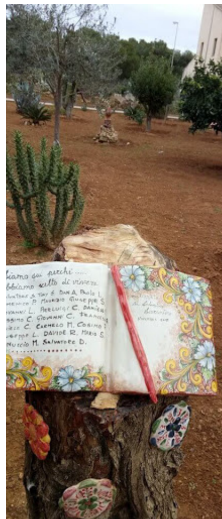
La comunità Oasi di Caltagirone